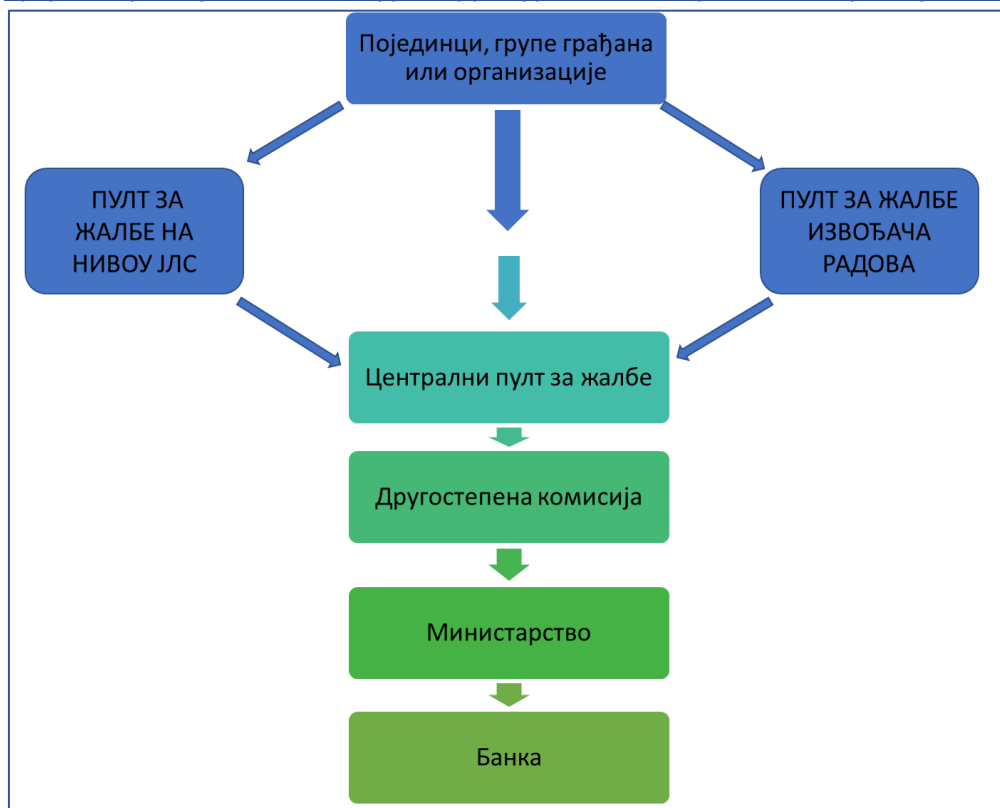
Слика 1. Шема функционисања жалбеног механизма