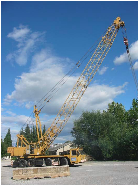
Sl. 13 LIEBHERR LG 1060 (levo) i LIEBHERR LT 1035 (desno)